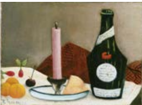
La Bougie rose , 1908 Huile sur toile, 16,2 × 22,2 cm Washington, The Phillips Collection, acquis en 1930, 1695

Ces images populaires rencontrent leur public et lui permettent de survivre financièrement. Elles constituent le corpus le plus important de son œuvre, et le plus représenté dans la collection du marchand Paul Guillaume. On y croise les pêcheurs à la ligne et les femmes chapeautéées des images d'Épinal dans des points de vue où se décline la modernité. Rousseau s'inspire de ses propres observations lorsqu'il parcourt les environs de Paris, alors en pleine mutation, et rend hommage aux premiers vols du biplan des frères Wright en 1908.