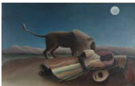
Huile sur toile, 167,0 x 189,5 cm. Paris, musée d'Orsay, legs Jacques Doucet, 1936

Cette œuvre convoque tant des références à l'orientalisme qu'à l'iconographie du jardin d'Eden. Le traitement est particulièrement soigné et l'artiste signe de son nom complet. Elle suscite pourtant un vif débat parmi le jury du Salon d'Automne, qui l'expose comme projet de tapisserie, niant ses qualités picturales. Commandée par Berthe Delaunay, mère du peintre Robert Delaunay, l'œuvre est achetée par le collectionneur Jacques Doucet. Dès 1925, il promet de la léguer au musée du Louvre : elle est alors la première œuvre de Rousseau à entrer dans les collections nationales françaises.