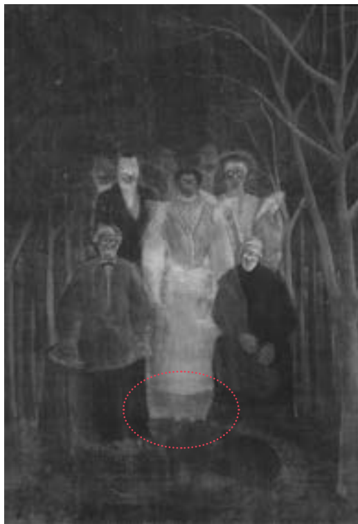
Radiographie de La Noce

Cette recherche matérielle croisée sur les collections françaises et de la Barnes est la plus vaste menée à ce jour sur des œuvres de l'artiste. Elle éclaire les pratiques de Rousseau, notamment ses choix de supports et de couleurs. Les principaux résultats sont publiés dans le catalogue d'exposition.