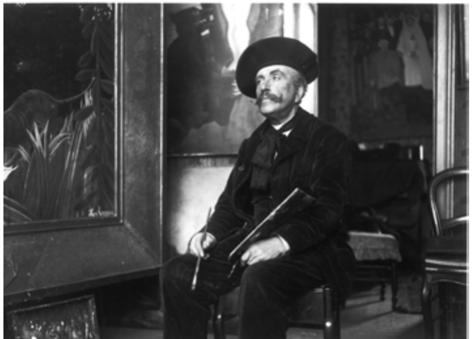
Paul François Arnold Cardon dit Dornac (1859-1941) Henri Rousseau assis à côté d' Éclaireurs attaqués par un tigre, Mauvaise surprise et La Noce dans son studio du 2 bis, rue Perrel à Paris, 1907