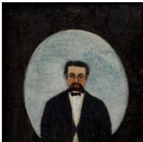
Huile sur bois, avec cadre H.41 ; L.38,5 cm Huile sur bois, avec cadre : H. 41 ; L.37,5 cm Musée de l'Orangerie, Paris Don de la SAMO avec la participation exceptionnelle de Mathias Ary Jan, 2024