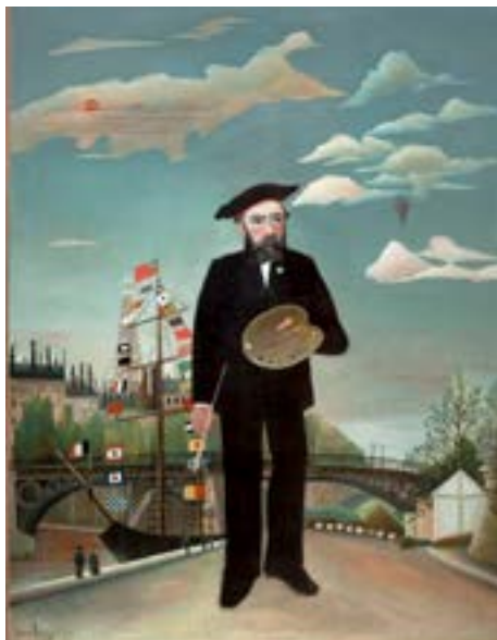
Huile sur toile, 146 x 113 cm National Gallery of Prague purchase from collection of Walther Halvorsen, 1923