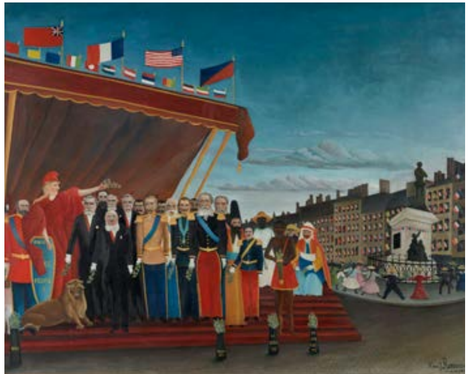
Les Représentants des puissances étrangères venant saluer la République en signe de paix, 1907 Huile sur toile, 130 × 161 cm Musée national Picasso-Paris. Donation de Picasso, 1978, Collection personnelle Pablo Picasso

Parallèlement, Rousseau s'emploie à des compositions ambitieuses. Il s'approprie les thématiques chères aux tenants de l'académisme : peinture d'histoire, genre allégorique ou portrait officiel. Sans crainte du paradoxe, il représente des artilleurs avec solennité, se désole de la guerre et porte haut les couleurs de la République. Envoyés au Salon des Indépendants, ces grands formats lui valent quelques articles de presse, qu'il consigne soigneusement et qu'il ne manque pas d'évoquer lorsqu'il sollicite le soutien de l'État.