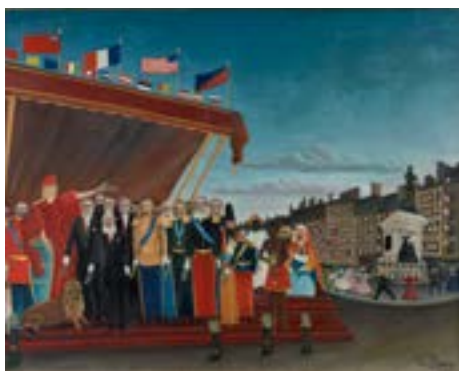
Les Représentants des puissances étrangères venant saluer la République en signe de paix, 1907 Huile sur toile, 130 × 161 cm Musée national Picasso-Paris. Donation de Picasso, 1978 Collection personnelle Pablo Picasso

La toile attire les regards au Salon, dont la date coïncide avec la seconde conférence de La Haye pour la paix. Le peintre nourrit alors l'espoir d'un achat par l'État. C'est finalement le marchand Ambroise Vollard qui en fait l'acquisition, puis Pablo Picasso, qui la conservera toute sa vie.