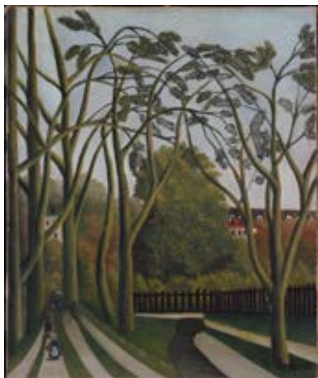
Les rives de la Bièvre près de Bicêtre, vers 1908-1909 Huile sur toile, 54,6 x 45,7 cm New York, The Metropolitan Museum of Art, don de Marshall Field, 1939