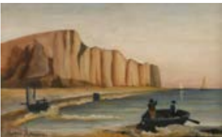
La Falaise , vers 1895 Huile sur toile, 21 x 35 cm Paris, musée de l'Orangerie, achat, 1959

Pour séduire une clientèle composée d'artisans, de commerçants et de petits bourgeois, Rousseau varie genres et formats et décline ses motifs les plus appréciés. Inspiré tantôt par des vues pittoresques, comme pour La Falaise , tantôt par une imagerie décorative comme ses bouquets et natures mortes, il peint sur de petites toiles, adaptées aux bourses et aux intérieurs modestes de ses amateurs.