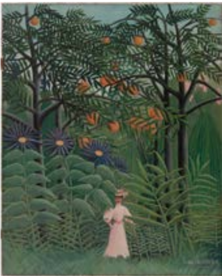
Femme se promenant dans une forêt exotique , vers 1910 Huile sur toile, 100 x 81 cm Philadelphie, The Barnes Foundation

Rousseau développe ces scènes de rencontres inattendues parallèlement aux succès de ses jungles. Il comprend tout l'intérêt commercial de ce répertoire particulièrement apprécié des amateurs. Peu après le décès de Rousseau, le critique et collectionneur Wilhelm Uhde, auteur de la première monographie du peintre, acquiert plusieurs d'entre elles, à des prix modestes, avant qu'elles ne suscitent l'intérêt croissant du marché dans les années 1920.