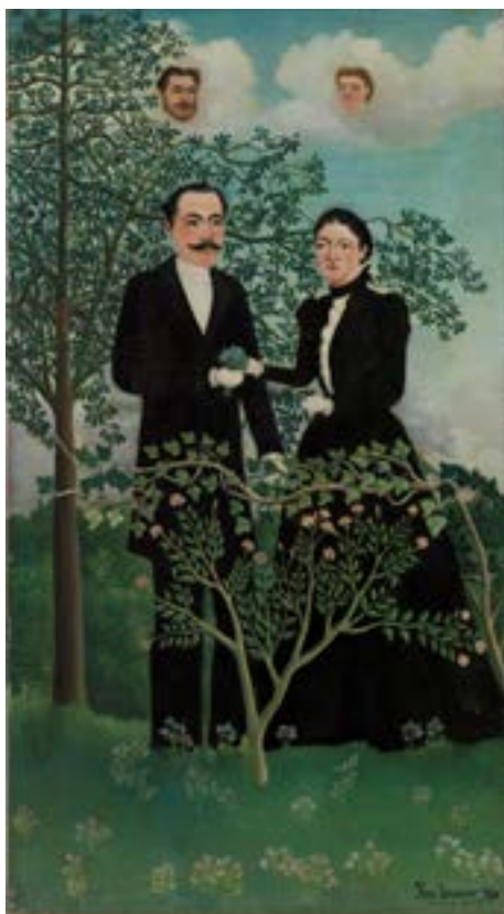
Huile sur toile, 85,2 x 46,8 cm Philadelphie, The Barnes Foundation

L'œuvre fait l'objet de critiques sur la maladresse de ses proportions au Salon des Indépendants. Elle est pourtant l'une des premières toiles de l'artiste à rejoindre un musée, en 1923.