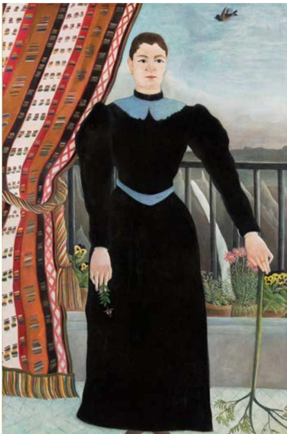
Huile sur toile, 160 × 105 cm Musée national Picasso-Paris. Donation Picasso, 1978. Collection personnelle Pablo Picasso, Photo © GrandPalaisRmn (musée national Picasso-Paris) / Adrien Didierjean