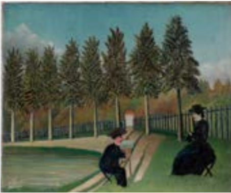
Le Peintre et son modèle, 1900-1905 Huile sur toile, 46,5 × 55,4 cm Paris, Centre Pompidou – musée national d'Art moderne / Centre de création industrielle. Legs de Nina Kandinsky, 1981

Les premières commandes de Rousseau émanent d'abord de son entourage : portraits féminins en pied, célébrations de baptêmes ou de noces, souvenirs d'une naissance ou d'une sortie dominicale, elles sont les reflets de son cercle social et artistique. Il conserve ses œuvres plus intimes hors du circuit marchand, mais les envoie au Salon pour démontrer ses talents.