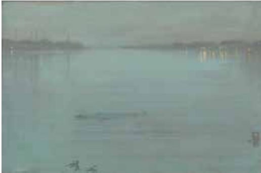
James Abbott McNeill Whistler, Nocturne en bleu et argent : les lumières de Cremorne , huile sur bois, 1872. Tate, Londres, legs d'Arthur Studd en 1919