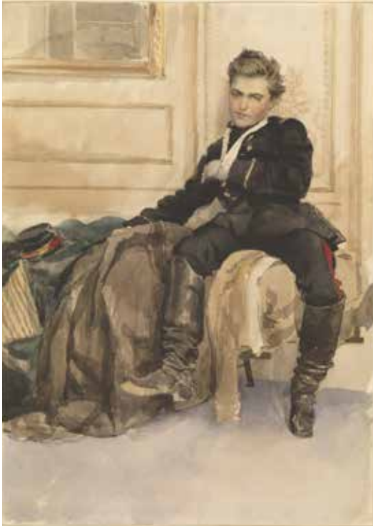
James Tissot, Le soldat blessé , vers 1870, aquarelle sur papier, Tate