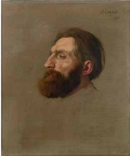
Alphonse Legros, Portrait d'Auguste Rodin, 1882, huile sur toile, Musée Rodin, Paris.