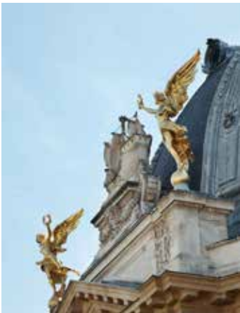
Petit Palais, musée des Beaux-Arts de la Ville de Paris