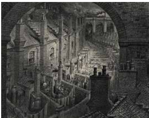
Gustave Doré, Au-dessus de Londres depuis une voie ferrée , gravure sur bois, Musée d'art moderne et contemporain de Strasbourg

En mai 1871, les armées gouvernementales mettent fin à l'insurrection parisienne, faisant environ 20 000 victimes civiles. Durant cette « semaine sanglante » de grands monuments sont incendiés. Leurs façades en ruine resteront en l'état pendant plusieurs années, vision désolée qui tranche avec la fièvre de construction que Paris avait connue sous le Second Empire.