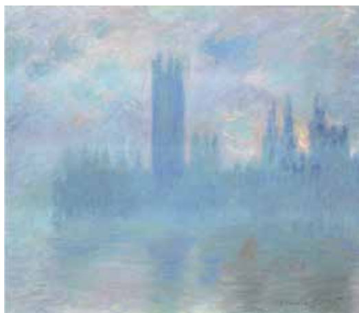
Claude Monet, Le Parlement de Londres, vers 1900-1901, huile sur toile, The Art Institute, Chicago. Mr and Mrs Martin A. Ryerson Collection