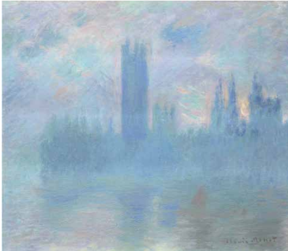
Claude Monet, Le Parlement de Londres, vers 1900-1901, huile sur toile, The Art Institute, Chicago. Mr and Mrs Martin A. Ryerson Collection

Exposition organisée par la Tate, en collaboration avec le Petit Palais, Paris Musées.