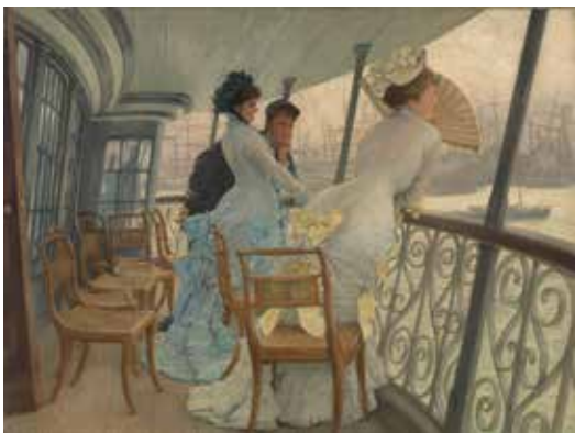
James Tissot, La Galerie du «HMS Calcutta» (Portsmouth), vers 1876, huile sur toile, Tate, Londres, don de Samuel Courtaud en 1936