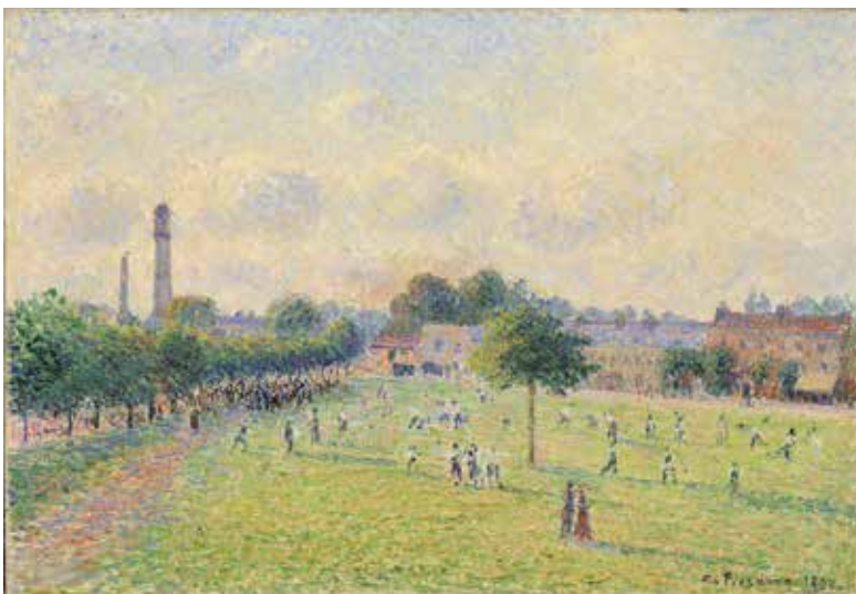
Camille Pissarro, Kew Green , 1892, huile sur toile, Musée d'Orsay, Paris, en dépôt au musée des Beaux-Arts de Lyon, legs de Clément et Andrée Adès, 1979

Enfin, l'« art studio », espace pédagogique situé dans le parcours, évoque un atelier d'artiste de la fin du XIX e siècle. À partir de dispositifs pédagogiques interactifs et d'œuvres originales (tableaux, gravures et sculptures), le visiteur y est invité à découvrir et à expérimenter la technique des artistes présentés dans l'exposition. Des animations gratuites et sans réservation, pour petits et grands, y sont proposées tout au long de l'exposition.