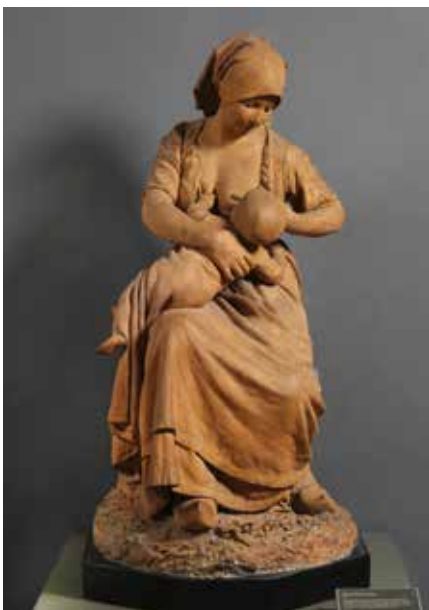
Jules Dalou, Paysanne française allaitant, 1873, terre cuite, Victoria and Albert Museum

Legros (1837-1911) était déjà parti s'installer à Londres avant la guerre pour des raisons économiques. Il se maria avec une Anglaise puis fut même naturalisé anglais en 1881. Son Ex-voto exposé à Paris au Salon en 1861 avait fait sensation auprès des peintres mais avait été mal reçu par la critique. Incompris, miséreux, Legros avait traversé la Manche dès 1863 sur les conseils de son ami Whistler. Il fut bien accueilli par les peintres anglais préraphaélites Rossetti, Watts et Burne-Jones. Le Français bénéficia du soutien de collectionneurs passionnés, en particulier dans la communauté d'origine grecque gravitant autour de Rossetti. À partir de 1870, Legros devint le principal recours pour ses compatriotes réfugiés. Monet et Pissarro le contactèrent, ainsi que Tissot et le marchand Paul Durand-Ruel. Avec générosité, Legros leur fit profiter de son réseau anglais. Le sculpteur Jules Dalou fut introduit par lui auprès des grands collectionneurs et mécènes qu'étaient les Howard et les Ionides; il aida de même Rodin, lorsque celui-ci chercha dix ans plus tard à conquérir le marché londonien. Remarquable professeur à la South Kensington School of Art, puis à partir de 1876 à la Slade School of Fine Arts, Legros dispensa en français (il n'apprit jamais l'anglais) et par l'exemple un enseignement renommé de dessin, de peinture, de gravure puis de modelage.