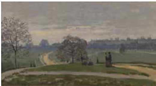
Claude Monet, Hyde Park , 1871, huile sur toile, Museum of Art, Rhode Island School of design, Providence, don de Mrs Murray S. Danforth

En 1870, la communauté française y est déjà bien implantée, notamment depuis qu'une première vague de réfugiés s'y est installée à la suite du coup d'État de Napoléon III en 1852. Après la semaine sanglante (mai 1871) environ 3 500 communards fuient à leur tour la France et resteront en Angleterre jusqu'à leur amnistie, en 1880.