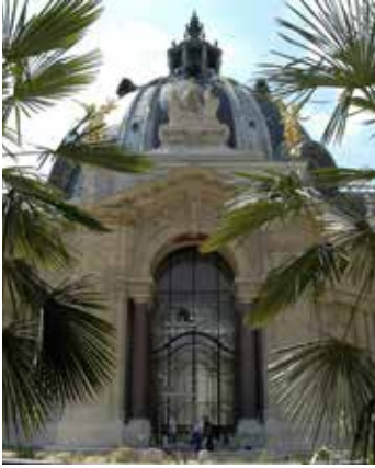
Petit Palais, musée des Beaux-Arts de la Ville de Paris