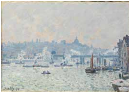
Alfred Sisley, Vue de la Tamise : le pont de Charing Cross, 1874, huile sur toile, Andrew Brownsword Arts Foundation, en dépôt à la National Gallery, Londres

Établi en Grande-Bretagne dès 1863, Alphonse Legros, encouragé par son ami d'alors Whistler, bénéficiait de solides relations dont il fait bénéficier les français venus lui demander aide et conseils. Le marchand Paul Durand-Ruel, qui possédait pourtant son propre réseau de galeristes et de clients à Londres, sollicita l'appui de Legros pour ses expositions de la Society of French Artists .