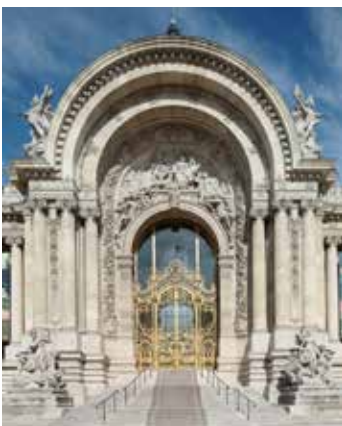
Petit Palais, musée des Beaux-Arts de la Ville de Paris

Construit pour l' Exposition universelle de 1900 , le bâtiment du Petit Palais, chef d'œuvre de l'architecte Charles Girault, est devenu en 1902 le Musée des Beaux-Arts de la Ville de Paris. Il présente une très belle collection de peintures, sculptures, mobiliers et objets d'art datant de l'Antiquité jusqu'en 1914 .