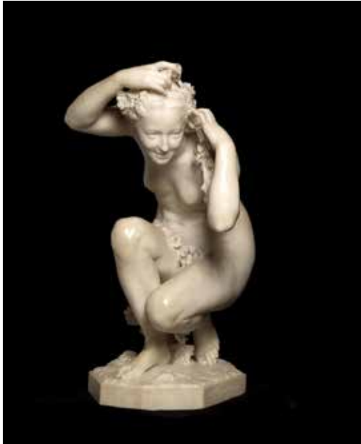
Jean-Baptiste Carpeaux, Flore , 1873, Museu Calouste Gulbenkian, Founder's Collection, Lisbonne